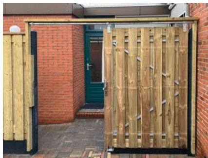
2. Poort dicht